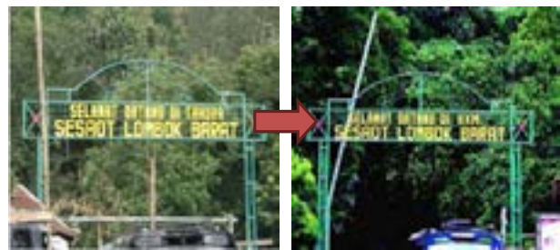
Gambar 3. Penggantian Nama “TAHURA” dengan “HKm” oleh Masyarakat Lokal sebagai Bentuk Penolakan TAHURA

organisasi lokal KMPH (Kelompok Masyarakat Pelestari Hutan). KMPH awalnya merupakan gabungan dari kelompok tani hutan di Desa Sesaot, Desa Lebah Sempage, dan Desa Sedau yang menjadi peserta uji coba HKm pada tahun 1995. Penguatan institusi indigenus dilakukan dengan menegakkan awig-awig pengelolaan hutan Sesaot. Nama “TAHURA Nuraksa” yang dipasang pada gapura di pintu masuk kawasan hutan Sesaot pun dicopot dan diganti masyarakat dengan nama “HKm”.