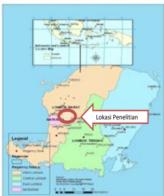
Gambar 1. Lokasi Hutan Sesaot, Lombok Barat

Hutan Sesaot terletak di sebelah barat Taman Nasional Rinjani, memiliki luas 5.950,18 Ha, dan merupakan daerah tangkapan air dari DAS Dodokan. Secara administrasi, kawasan hutan ini terletak di Kecamatan Narmada dan Lingsar, Kabupaten Lombok Barat, dan diapit oleh empat desa, yaitu Sesaot, Lebah Sempage, Sedau, dan Batu Mekar. Berdasarkan SK Menteri Pertanian Nomor 756/Kpts/Um/1982, status dan fungsi hutan Sesaot adalah hutan lindung. Penetapan hutan Sesaot sebagai hutan Lindung didasarkan atas pertimbangan fungsi hutan sebagai sumber mata air bagi irigasi pertanian dan kebutuhan air bersih bagi rumah tangga, khususnya di Kota Mataram, Kabupaten Lombok Barat, dan sebagian Kabupaten Lombok Tengah (Galudra et al, 2010).