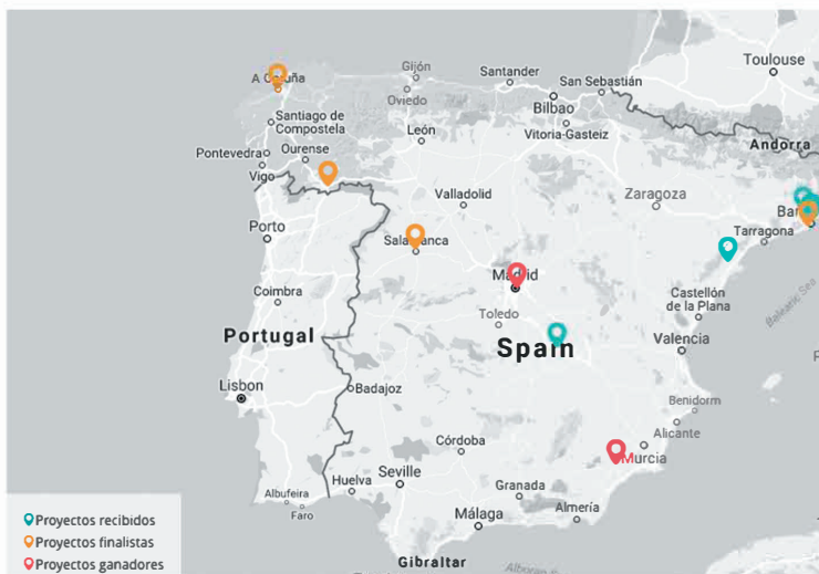
Mapa de proyectos de bibliotecas públicas para la inclusión social. 2016.