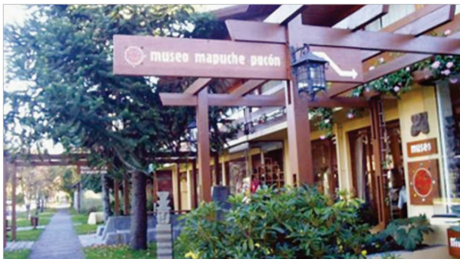
Museo Mapuche en Pucón

Sólo dos museos ( Histórico de Carabineros y Nacional de Historia Natural ) poseen planes estratégicos de comunicación. Un tercero lo tuvo sin ejecución porque el museo permanece cerrado por reformas ( Arqueológico de La Serena ). Las razones que los siete museos restantes esgrimen sobre la ausencia de un plan son, principalmente, la limitación de los recursos profesionales, que se expresa en conocimiento técnico específico insuficiente en los encargados ( Historia Natural de Valparaíso); falta de personal y de recursos para comunicación ( Geológico Lajos Biró Bagoczky , Gustavo Le Paige , Isla de Maipo ); o tiempo escaso para los profesionales a cargo ( Arqueológico de La Serena ). También se señala que no exis-