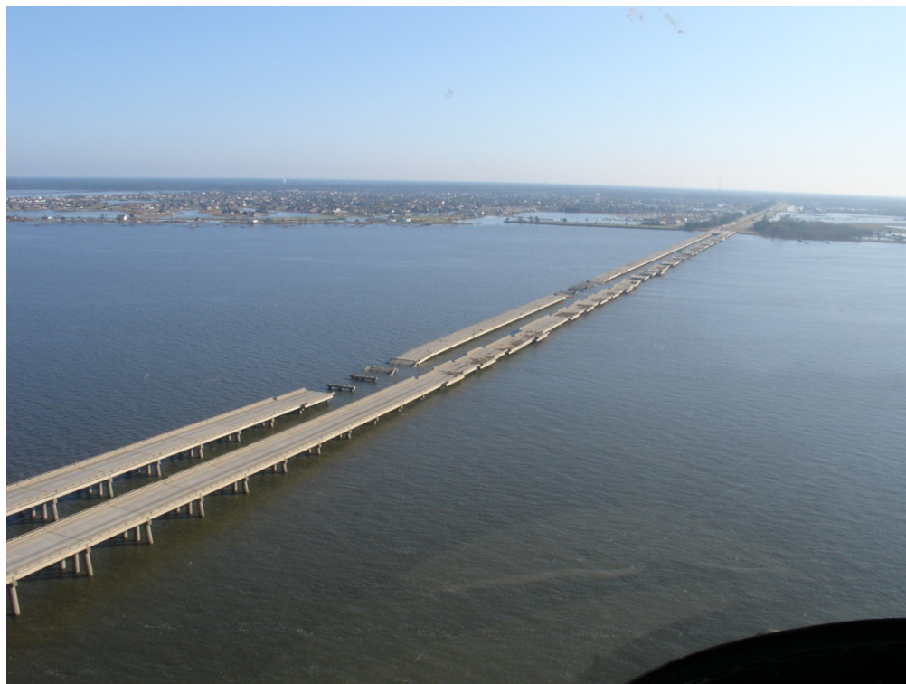
Figura 2: Daños causados por el huracán Katrina en los puentes gemelos de la autopista interestatal I-10 sobre el lago Pontchartrain en el estado de Luisiana (adaptado del Departamento de Transportación del estado de Luisiana).

Los condados costeros en los Estados Unidos contienen alrededor del 50% de la población total de esta nación. Sin embargo, estos condados tan sólo representan el 20% del área de superficie geográfica de los Estados Unidos. Las zonas donde están localizados estos condados son propensas a riesgos costeros tales como lo son las inundaciones, huracanes y tsunamis (ver Figura 2).