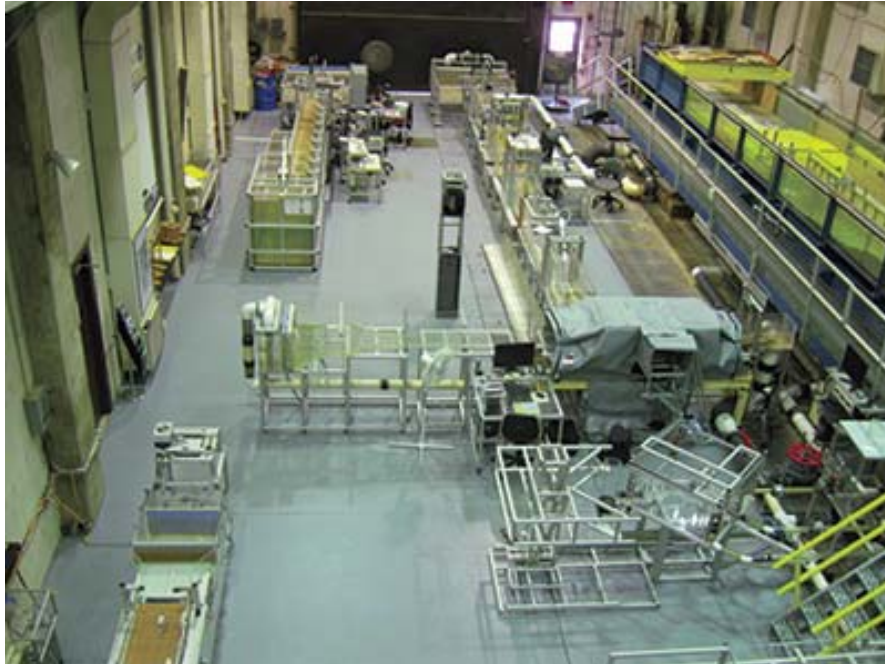
Figura 3: Vista de varios estanques de prueba del Laboratorio de Hidráulica J. Sterling Jones localizado en el Centro de Investigación Carreteras Turner-Fairbank en McLean, Virginia.

pilastras de un puente y de un puente con loza sumergida. El laboratorio consiste de una planta física y de un centro de modelación numérico. La planta física ofrece un estanque de inclinación movable, un estanque para conducir estudios de equilibrio de fuerzas, un estanque de oleaje, una estación para conducir experimentos con imágenes velocimétricas y una instalación para pruebas de alcantarillas. El centro de modelación numérica incluye sistemas para realizar simulaciones basadas en cálculos de la dinámica de fluidos (FHWA, 2007).