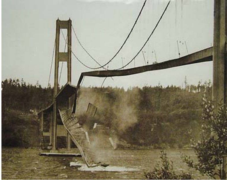
Figura 4: Colapso del puente Tacoma Narrows en el estado de Washington (Bosch, 2011).

El Laboratorio de Aerodinámica es la única instalación en los Estados Unidos dedicada a conducir investigaciones utilizando un túnel de viento dedicado exclusivamente al estudio de los efectos del viento en estructuras de transporte (ver Figura 5). Al igual que el Laboratorio de Hidráulica, el Laboratorio de Aerodinámica tiene la capacidad para llevar a cabo modelos y pruebas físicas así como numéricas. El laboratorio posee un túnel de viento de gran escala tipo circuito abierto de velocidad baja y laminar, y otro túnel a menor escala que utiliza humo para la visualización de flujo. Estudios en este laboratorio han incluido el diseño del sistema de amortiguamiento para puentes tipo cable sostenido, pruebas en el túnel de viento para diseños nuevos o propuestos, evaluación de problemas de rendimiento y diseño de modificaciones, y análisis estático, dinámico y aerodinámico de puentes de segmentos largos (FHWA, 2001).