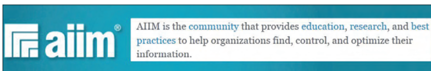
Association for Information and Image Management, http://www.aiim.org

Los fácilmente identificables son los que nos permiten contextualizar el documento en sí y sin los cuales sería imposible entender de qué trata. Pero también son metadatos la información que nos permite clasificar los documentos en una estructura predefinida, limitar o expandir el acceso y uso, identificar las acciones de disposición o preservación previstas para uno determinado o recoger los eventos que han sucedido a un documento a lo largo del tiempo.