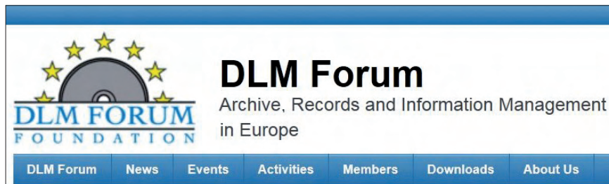
Document Lifecycle Management Forum, http://www.dlmforum.eu

recursos. Los especialistas en gestión documental podemos proponer reconocer la autenticidad de documentos internos basándose en los usuarios y contraseñas y establecer mecanismos que aseguren la integridad de todos los documentos con independencia de su autenticidad basándose en la restricción de permisos, el audit log (registro de accesos para controlar cambios) y en procedimientos internos que pueden incluir tanto soluciones de hardware como de software.