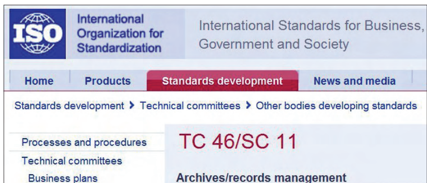
International Organization for Standardization, http://www.iso.org

No estamos acostumbrados a trabajar con los conceptos de análisis de riesgos, pero en la gestión de documentos es un