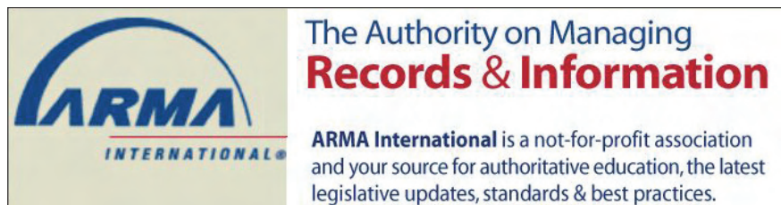
International Records Management Association, http://www.arma.org/

Hablando de documentos electrónicos la gestión de los metadatos se convierte en la verdadera gestión documental. Si entendemos como documentos electrónicos los ficheros que contienen información (un pdf, un excel, una imagen, un vídeo, un registro de base de datos, un sms, etc.), y denominamos metadatos a toda la información que es necesaria para gestionarlos, nos damos cuenta que cualquier proceso documental es en realidad un proceso de captura, gestión y explotación de metadatos.