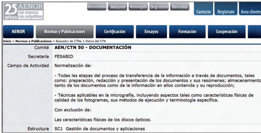
Asociación Española de Normalización y Certificación, http://www.aenor.es

Cuando leí por primera vez el tema de éste número de EPI “archivos administrativos e intranets” lo identifiqué con la gestión de documentos tal como he definido en el párrafo anterior. Pero me asaltó una gran duda ¿podemos/debemos seguir hablando de archivos administrativos?