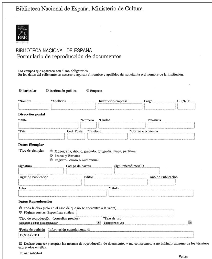
Figura 2. Formulario de reproducción de documentos de la Biblioteca Nacional de España

Sólo los centros dependientes de grandes instituciones cuentan con departamentos de fotografía y especialistas capacitados para realizar sus funciones