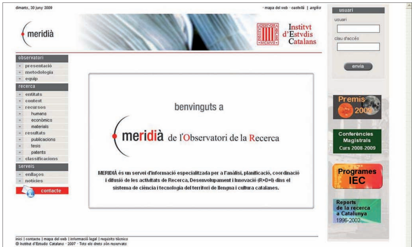
Figura 1. Meridià. http://meridia.iec.cat

– Rectores y vicerrectores de las universidades públicas y privadas.