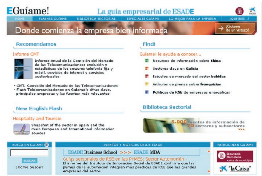
Figura 3. Homepage actual

– Memorias de empresas y Responsabilidad social (RSE) : Acceso a los informes anuales, políticas de RSE, medio ambiente y sostenibilidad de las 250 mayores empresas