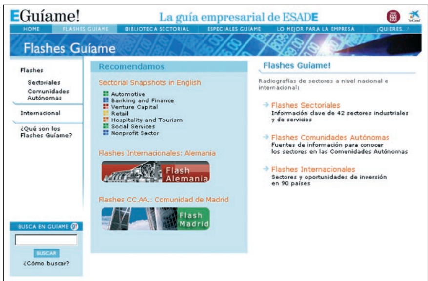
Figura 4. Sección “Flashes Guíame!”

– Dossiers Esade Guíame! : Monográficos que permiten rea-