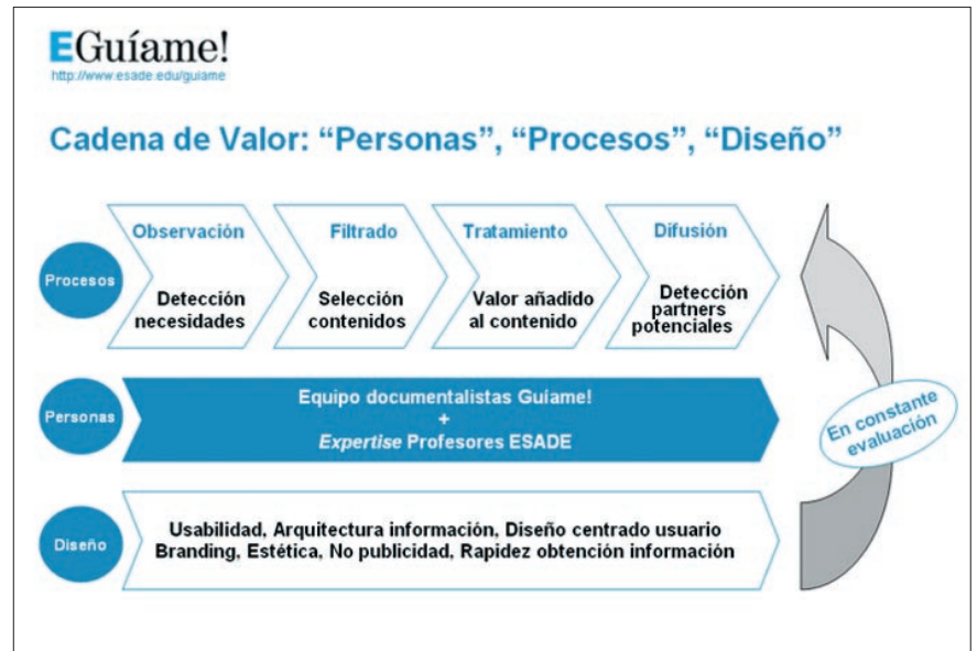
Figura 5. Cadena de valor de Guíame!

El equipo de Guíame! realiza un seguimiento diario de la prensa económica y de la actividad de las principales asociaciones, organis-