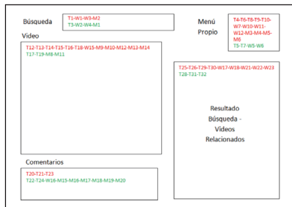
Fig. 3: Prototipo del framework propuesto para el diseño de la interacción en RSV.

En la Fig. 3 se presenta una versión prototipo del framework, con los elementos de interacción obligatoria (rojo) y opcional (verde), y las funcionalidades definidas.