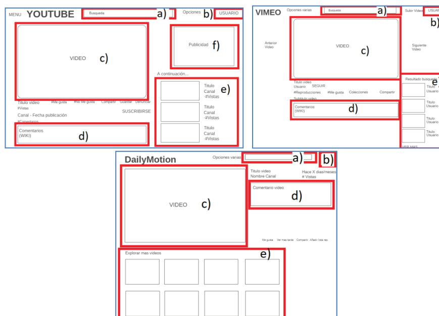
Fig. 1: Wireframes de los portales YouTube, Vimeo, y Dailymotion.

La reproducción de la organización de espacios y elementos obtenidos mediante wireframes (Fig. 1), resultantes de la pantalla “Resultado de la búsqueda” de las RSV analizadas, se lograron encontrar cinco espacios comunes.