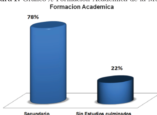
Figura 1. Gráfico % Formación Académica de la Muestra