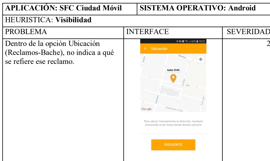
Tabla 2. Ejemplo Planilla de recopilación de datos.