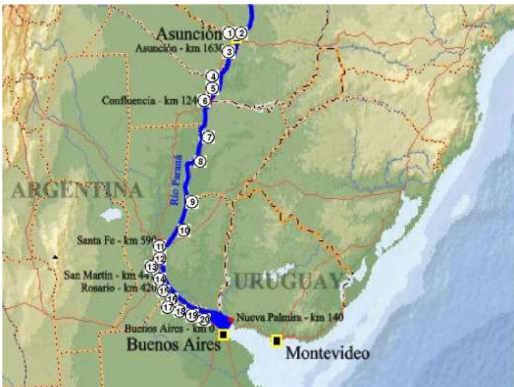
Figura 1: Localización de sitios de muestreo

La campaña de muestreo fue realizada por la Prefectura Naval Argentina, en el Buque Científico “Dr. Leloir” (Figura 2), acondicionado con equipamiento de muestreo (botella de Niskin, draga tipo Eckman, corers, redes de plancton) e instrumental para medición de parámetros in situ (pH, oxígeno disuelto, temperatura, conductividad y turbiedad) (Figura 3). Los peces fueron obtenidos con artes convencionales de pesca (redes, trasmallos y caña).