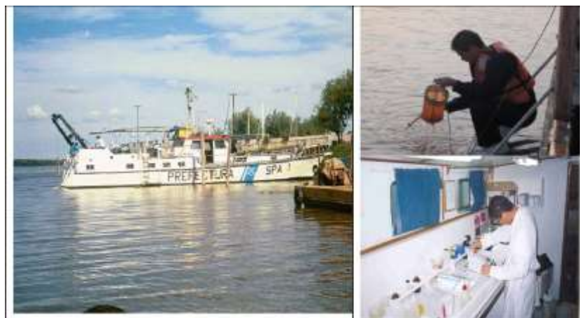
Figura 2: Embarcación y vistas del equipamiento de muestreo y análisis in situ .