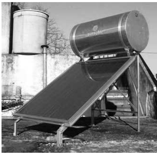
Fig. 4: Vista lateral del equipo compacto de 105 litros, colector, tanque y estructura de soporte

Estas configuraciones permiten comercializar los equipos de 105 lts. a $ 2.880. (Fig. 4) y $ 4770 el equipo de 200 lts. (Fig. 5) y le otorgan una vida útil estimada superior a 12 años. Ante la dificultad para contar con un banco de ensayos bajo Normas IRAM para ensayos y mediciones, se realizaron cálculos en régimen estacionario, con los siguientes resultados, K_o 0,76 y K_p -5,63 [4][5][6].