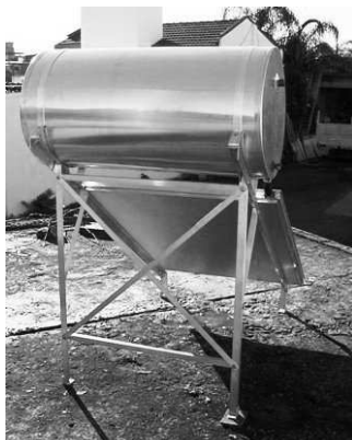
Fig. 2: Imagen de la estructura en perfiles de aluminio natural