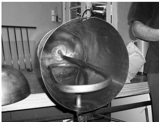
Fig. 1: Montaje del intercambiador de calor

La estructura de soporte (Fig. 2) tiene una inclinación de 35° que considera la captación de la radiación solar a lo largo del año en la franja media y norte del país y está materializada en perfiles de aluminio y bulones de acero inoxidable. El diseño de la placa captadora, parrilla y absorbedor, se proyectó para favorecer el flujo termosifónico, acelerando la circulación, disminuyendo la pérdida de carga y las pérdidas en el colector, aumentando el rendimiento general del conjunto. Las dimensiones y otras consideraciones técnicas forman parte de comunicaciones presentadas previamente en reuniones de trabajo de ASADES. Se verificó el correcto funcionamiento del intercambiador de calor, registrándose diferencias de temperatura entre mando y retorno de 8-15°C entre las 10 y las 17 horas, comprobando así la entrega de calor al circuito secundario (Fig. 3).