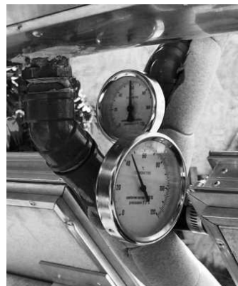
Fig. 3: Verificación y evaluación de la termocirculación

Estas configuraciones permiten comercializar los equipos de 105 lts. a $ 2.880. (Fig. 4) y $ 4770 el equipo de 200 lts. (Fig. 5) y le otorgan una vida útil estimada superior a 12 años. Ante la dificultad para contar con un banco de ensayos bajo Normas IRAM para ensayos y mediciones, se realizaron cálculos en régimen estacionario, con los siguientes resultados, K_o 0,76 y K_p -5,63 [4][5][6].