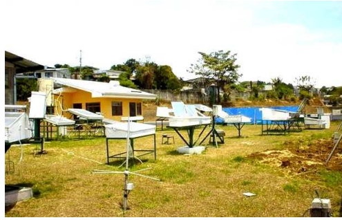
Figura 1. Algunos artefactos solares, diseñados, estudiados e instalados en nuestro parque solar.

Aunque se ha transferido y divulgado el conocimiento adquirido en todas estas áreas, la mayor área de transferencia tecnológica ha sido sobre Cocinas y Secadores Solares, por lo tanto, se ha dirigido principalmente la temática hacia estas dos aplicaciones. Antes de explicar sobre diferentes formas de transferir nuestra experiencia, se informara en breve la construcción y funcionamiento de una Cocina y un Secador Solar, diseñada, construida y estudiada por el autor.