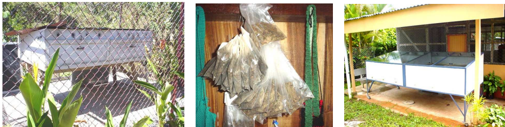
Figura 7. Secador Solar diseñado y construido para una comunidad en Costa Pájaro, Costa Rica, con el fin de secar plantas medicinales y otro en Puriscal para secar marañón

Al igual como sucede con las cocinas solares, es a través de las consultas, charlas y seminarios, que un número muy significativo de personas han construido secadores solares para usos personales. Por otro lado, según las solicitudes realizadas por las diferentes ONG's y empresarios, el autor ha diseñado y construido cuatro secadores solares de tamaño de 2- 4 m 2 , en las comunidades de Costa Pájaro y Puriscal, con el objetivo de secar marañón, plantas medicinales, limones, etc. La Figura 7 muestra uno de estos modelos, el cual es utilizado para deshidratar plantas medicinales, este se encuentra ubicado en una finca que se dedica al turismo ecológico y se observa el modelo que se usa para secar marañón en Puriscal.