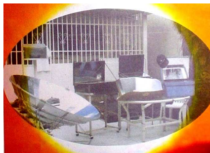
Figura 2. Hornos/ Cocinas Solares diseñados e estudiados por el autor.

Aparte de la cocina solar convencional explicada anteriormente, se han diseñado y estudiado las que se denominan: cocina híbrido (Sol- eléctrica), cocina con secador, cocina con calentador, cocina híbrida con pasteurizador y secador, etc. (Figura 2, derecha) cuyos detalles y especificaciones ya han sido publicadas en diferentes revistas, Nandwani (2005).