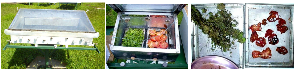
Figura 3. Secadores Solares pasivos, localizados en la Universidad y en una casa de habitación.

Por otra parte, en el año 1997 se diseñó y construyó, una cocina con secador solar (Figura 3, centro) para uso personal en la casa, con el fin de secar los productos comunes de la casa tales como: condimentos, tomate, cebolla, banano, piña etc. Este artefacto sigue funcionando hasta la fecha. (Figura 3, derecha)