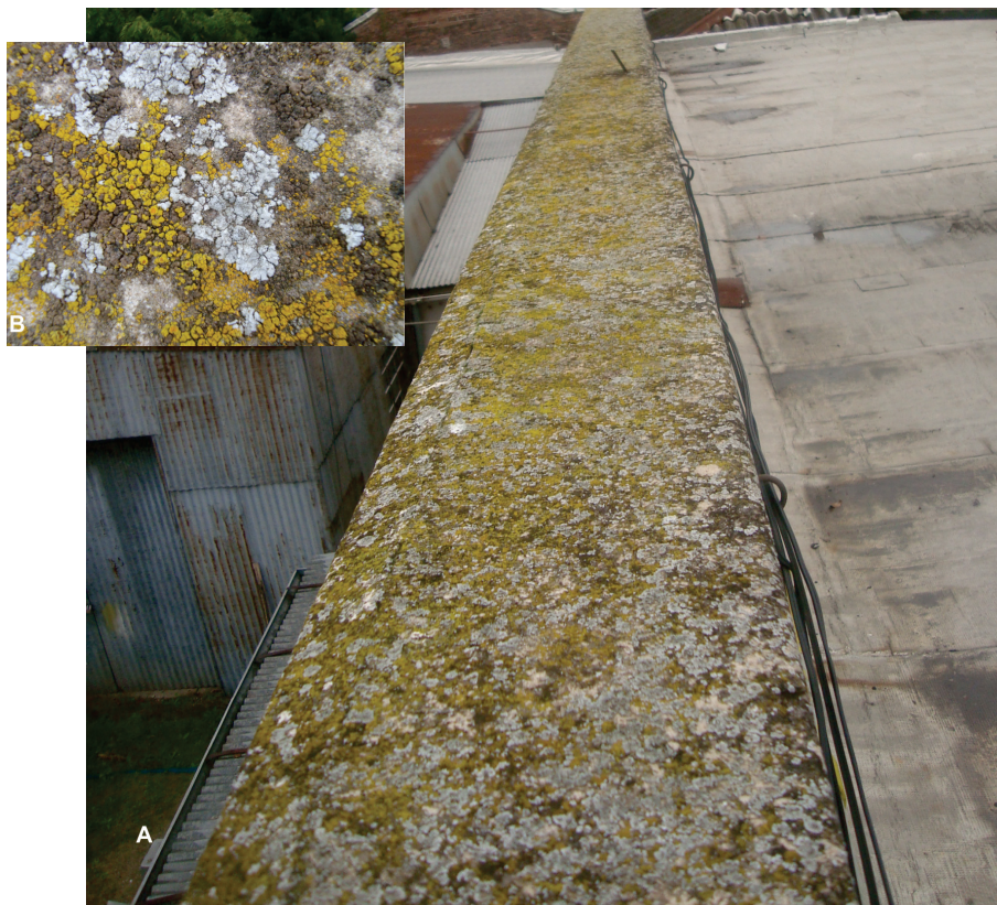
Fig. 1. A: Muro del edificio donde se realizó el muestreo; B: Detalle de las especies F. austrocitrina , C. teicholyta y S. monosporoides .

ficios. Para ello se propone aquí analizar a las especies que han colonizado un edificio urbano de acuerdo a sus capacidades competitivas dentro de la comunidad.