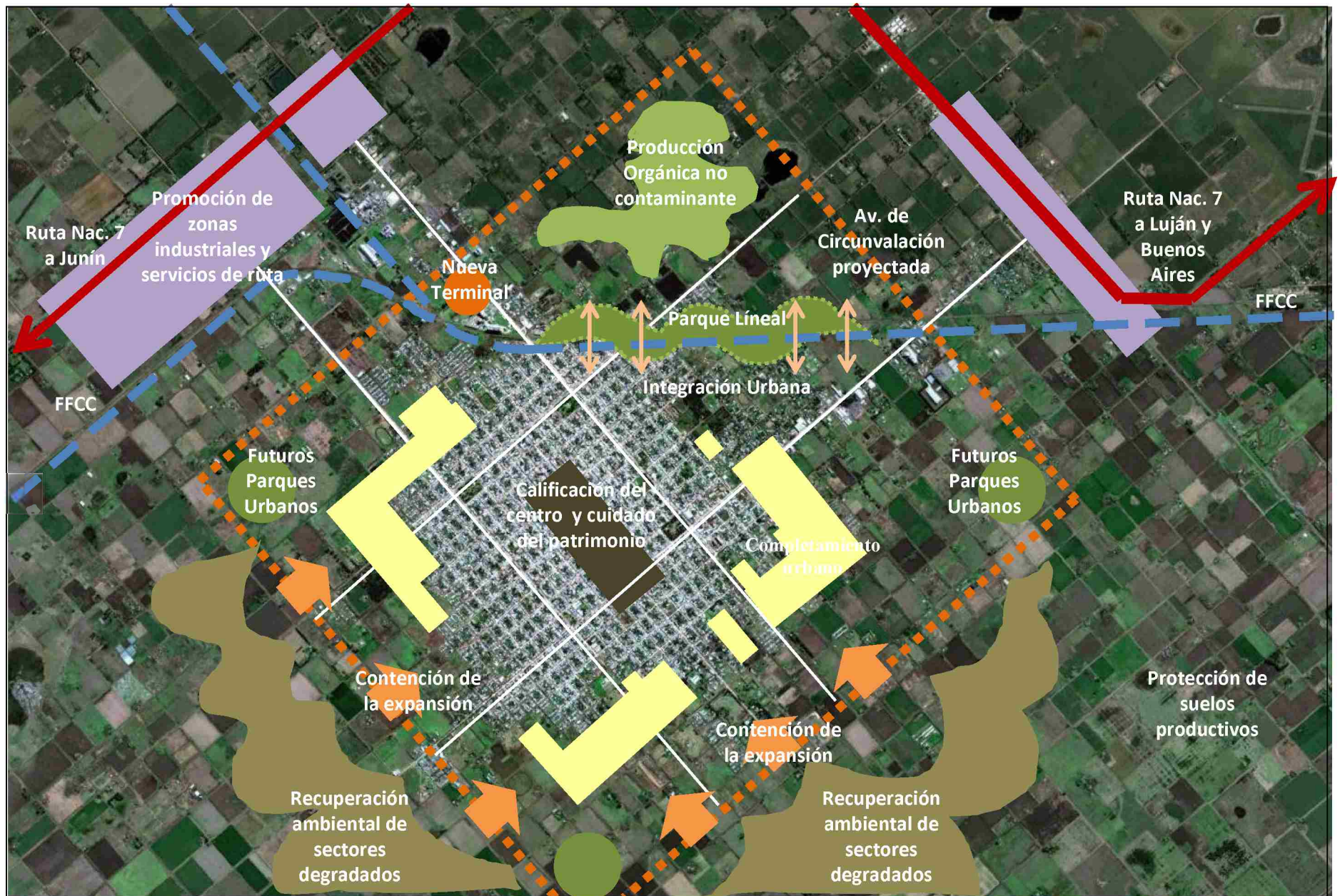
sustentabilidad + ordenamiento urbano