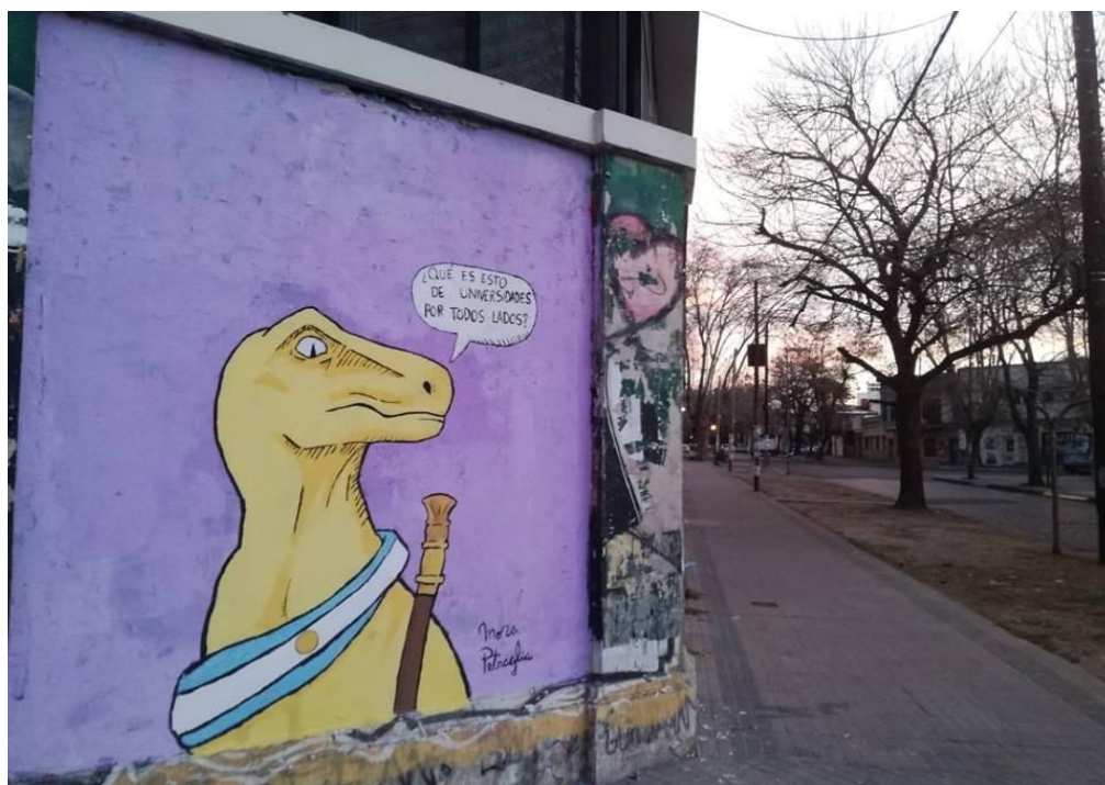
Figura 1. Pintura mural (2018), Mora Petraglia. Sede Fonseca, Facultad de Bellas.