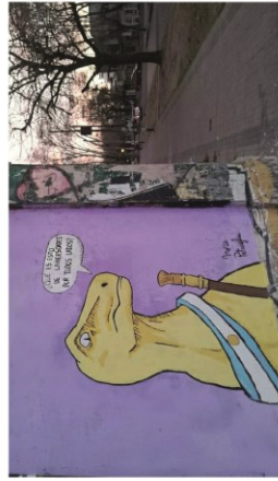
Figura 1. Pintura mural (2018), Mora Petraglia. Seefe Fonseca, Facultad de Bellas.