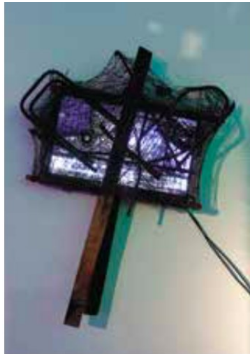
Silicona TV. Recuperado del catálogo de exposición

Podemos pensar que esta televisión obturada, que no nos permite ver las imágenes que refleja, nos invita a detenernos y reflexionar sobre lo que en realidad vemos en la programación de la televisión en el día a día, la “televisión basura” que nos adormece y nos permite distraernos sin reflexionar sobre lo que se nos muestra.