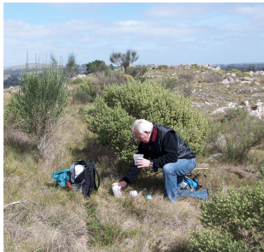
Fig. 2. Trampa de caída empleada en el muestreo en una sierra próxima a la ciudad de Tandil.

integran las sierras de Tandil como dato distribucional de las especies; y del material procedente de las tareas de muestreo desarrollada por los autores en el área estudiada, sectores serranos cercanos a la ciudad de Tandil. En este último caso se mencionan solo a aquellos especímenes que han podido ser determinados a nivel específico. En aquellos casos en que se mencionan especies no determinadas hasta este nivel, se comenta el por qué de su mención. Las colectas se realizaron con redes de arrastre, redes de golpe, trampas de caída y trampas de luz (Fig. 2).