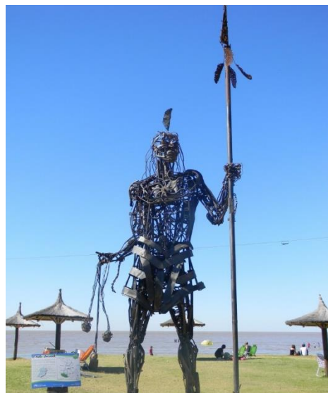
Figura 1: Monumento al Indio Querandí.

Crear un diseño aborigen significa buscar en el pasado para construir el futuro. Es la búsqueda de una estética auténticamente nuestra, para asegurarnos la conservación del arte aborigen y así este forme parte importante de nuestra identidad. Es nuestra tarea no solo sacar a la luz a las distintas culturas regionales sino también darles nueva vida, ligándolas al presente, reelaborándolas y dándoles