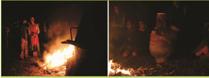
Figura 4. Horneada.

Por su parte, en el resultado final se puede apreciar una gran diversidad de objetos, desde funcionales hasta piezas escultóricas, hechas tanto por ceramistas profesionales como por aficionados (figura 5). Ahora bien, si estas producciones podemos hablar de Diseño o no, es una discusión que escapa a los intereses de esta ponencia. Lo cierto es que, en primer lugar, en ellas se encuentran implícitos aspectos simbólicos propios del imaginario y los valores que promueve esta festividad. En segundo lugar, una de las cosas más destacables es la modalidad de trabajo comunitario donde todos los participantes toman un rol proactivo en cada una de las actividades.