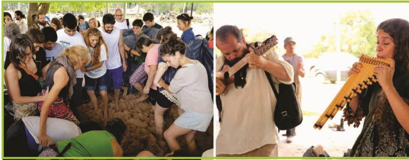
Figura 2. Pisada comunitaria.

En el tercer día, mientras se van terminando de modelar las piezas, se comienza con la construcción participativa del horno. Lo que se destaca aquí, es que en cada una de las ediciones el horno fue elaborado con técnicas diferentes. En la 3ª fiesta, el horno consistía en una cúpula armada con ladrillos uniéndolos y revocándolos con adobe (mezcla de barro y paja). 13 En la 4ª y última edición las piezas fueron mucho más grandes que años anteriores, esto obligo a repensar la manera de cocinarlas. El horno fue construido sin adobe, sino que directamente mediante la superposición de ladrillos distribuidos de manera tal que desde la cámara de combustión el fuego logra envolver las piezas de arcilla colocadas dentro y así alcanzar la temperatura para su adecuada cocción (figura 3).