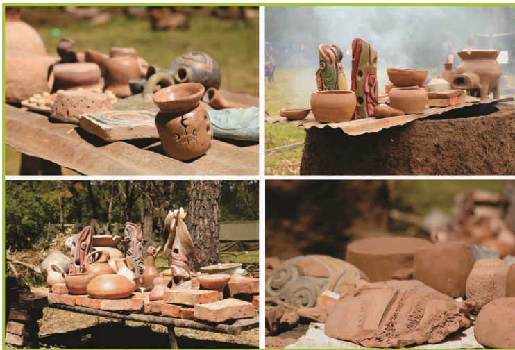
Figura 5. Objetos producidos por los participantes del taller.

Esta experiencia obliga a repensar los diferentes campos de intervención para nuestra disciplina y por sobre todo nuestro rol como profesionales dentro de este contexto.