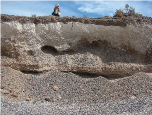
Fig. 3.- Frente de cantera donde es posible observar la presencia de carbonato de calcio en la parte superior del perfil

Además de su utilización en los diferentes caminos provinciales, vecinales o internos de los diferentes establecimientos, estos materiales son explotados por los pobladores rurales o urbanos como materiales de construcción, ya sea como áridos en la elaboración de hormigón o directamente en la construcción de paredes, tapias, etc. En estos casos los materiales son extraídos de la playa actual o de canteras que normalmente tienen un tamaño y profundidad mayor.