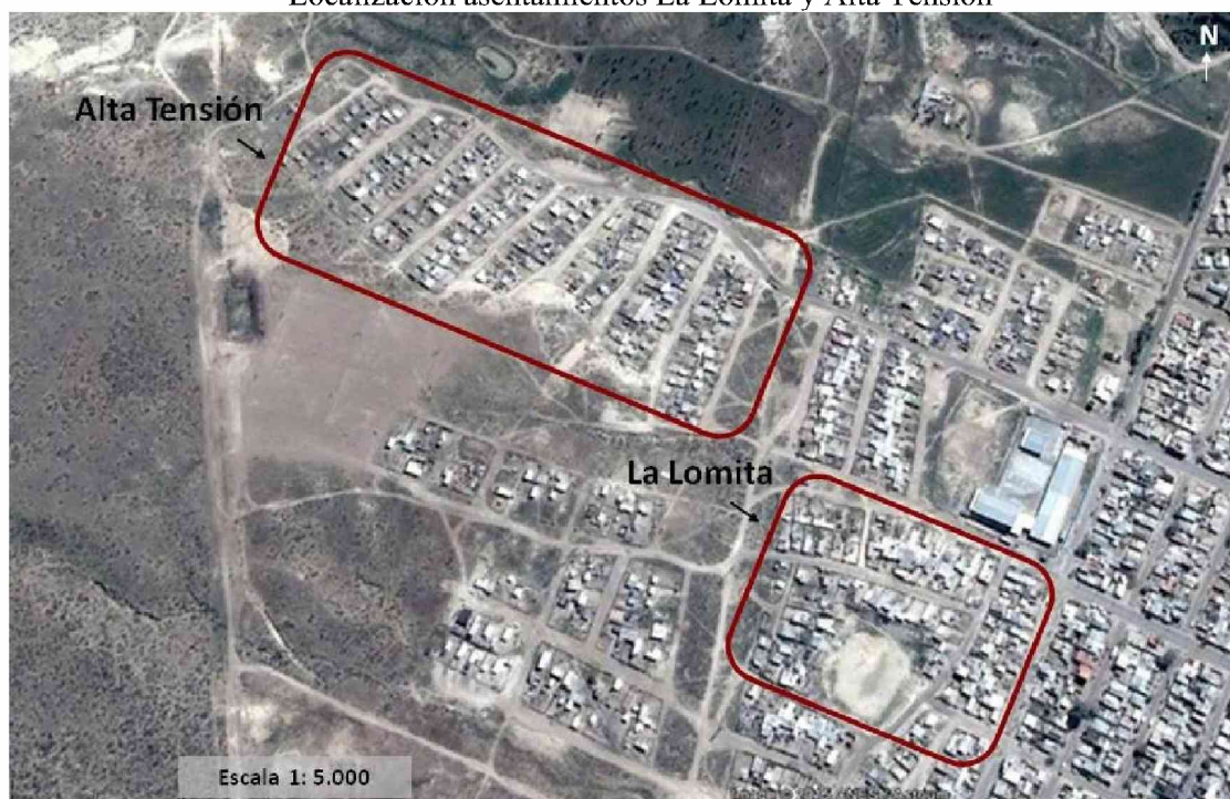
FIGURA 5 Localización asentamientos La Lomita y Alta Tensión