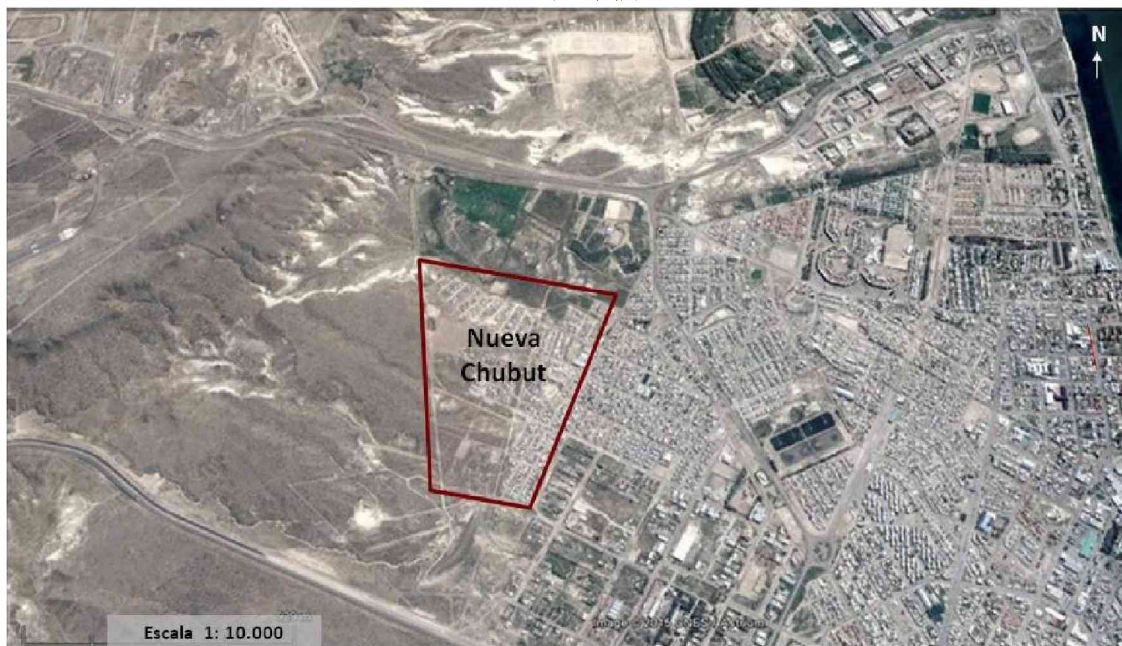
FIGURA 4 Área de estudio