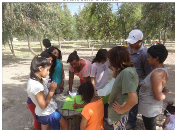
FIGURA 6 Taller Alta Tensión