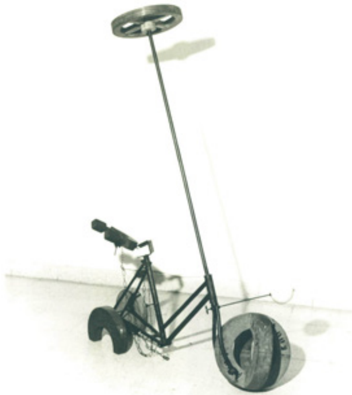
Figura 2. Edgardo A. Vigo, Bi-tricicleta ingenua (con ruedas incapaces de rodar) (1960).

Bi-tricicleta ingenua (con ruedas incapaces de rodar) [Figura 2] y con ella da su primer Paseo Visual en 1961. Vigo la modificará en 1990 y dará su Segundo Paseo Visual , esta vez en 1991 en Espacio Fundación San Telmo, documentando estos dos paseos visuales estáticos a través de fotoperformance. Estos puntos de inserción técnica, este dejar sus máquinas abiertas, son los que permitirán a Vigo estar constantemente modificando y rearmando sus propias obras. Con relación a su Bi-tricicleta modificada en 1990, Vigo (1994) nos narra la siguiente anécdota: