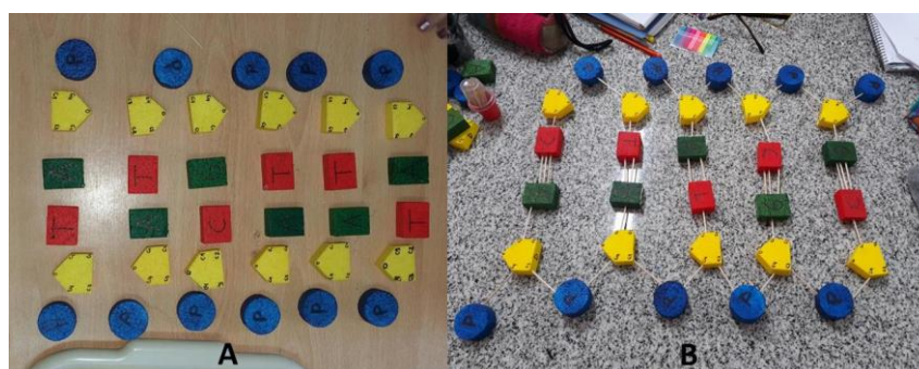
Figura 1. A) Representación de los desoxiribonucleótidos del ADN. B) Modelo de ADN constituido por 5 pares de nucleótidos complementarios.

momento de la clase estuvo destinado a recuperar de forma aplicada o práctica ciertas nociones discutidas en la etapa anterior; para ello se planteó la siguiente cuestión: A partir de las consideraciones teóricas discutidas sobre el tema y valiéndose de las distintas figuras de telgopor que serán entregadas para el desarrollo del Trabajo Práctico: a) Identifiquen cada figura con cada uno de los constituyentes de los nucleótidos. Discutan las principales características de dichas moléculas (Figura 1A). b) Representen los cuatro tipos de monómeros propios del ADN o desoxiribonucleótidos para cada una de las bases nitrogenadas (A, G, C, T). (Figura 1A). c) Considerando las propiedades de la molécula, elaboren un modelo del ADN constituido por 5 pares de nucleótidos complementarios. (Figura1B)