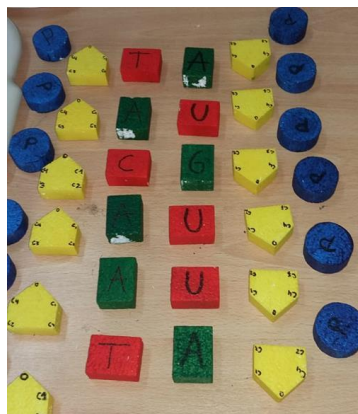
Figura 3. Modelo generado por los estudiantes sobre la secuencia de bases de la cadena de ARNm que se obtiene a partir del segmento indicado de ADN.