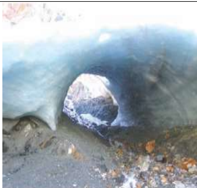
Figura 9. La cueva de hielo que se ha mostrado en las figuras 5 y 7, en febrero de 2006. Nótase la extensión mucho mayor de la cueva de hielo. El túnel de hielo es ahora mucho más corto que en años anteriores. Este sitio es de gran interés turístico pues frecuentes excursiones de trekking son ofrecidas comercialmente para visitar las 'Cuevas de Hielo del Alvear'. Es muy probable que en 2007 o 2008 ya no haya más cuevas de hielo para ser visitadas por los turistas, debido al colapso del techo de las cuevas.

Un destino similar está afectando a la mayoría de los pequeños glaciares de montaña y las lenguas de descarga que emergen de los mantos de hielo supérfites de Patagonia y Tierra del Fuego, tales como el Manto de Hielo Patagónico Norte en Chile, el Manto de Hielo Patagónico Sur de Argentina y Chile, el Manto de Hielo de la Cordillera Darwin y otros casquetes de hielo menores en el Archipiélago Magallánico en Chile. En el sector argentino de la Isla Grande de Tierra del Fuego, los glaciares de tipo alpino de los Andes Fueguinos están en un abrupto y violento retroceso como se observa en las fotografías correspondientes al Glaciar Martial y el Glaciar Monte Alvear Este (figuras 4 a 10). Muy probablemente, entre los años 2020-2030, la mayoría de estos cuerpos de hielo se habrá desvanecido, generando una pérdida invaluable desde el punto de vista del medio ambiente, el aporte de di-