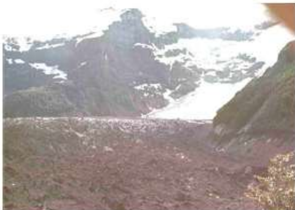
Figura 11. Fluctuaciones recientes del Glaciar del Río Manso, Cerro Tronador, Parque Nacional Nahuel Huapi, lat. 41° S, Patagonia septentrional, Argentina, en 1972. Este glaciar es una lengua glaciaria de valle, regenerada y cubierta por detritos.