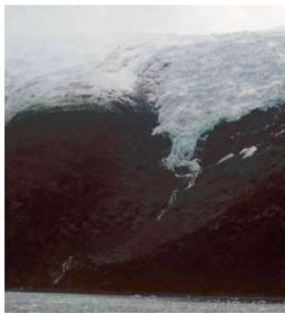
Figura 3. El mismo tributario, ahora visto desde el norte en 2004. El frente del hielo del Glaciar Upsala en contacto con el Lago Argentino ha retrocedido más de 8 km en este período, permitiendo que los barcos que navegan dicho lago lleguen hoy a posiciones en este brazo de tipo fiordo que no podían ser alcanzadas en 1981.