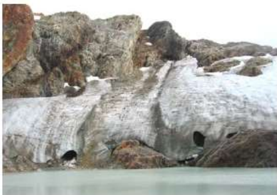
Figura 4. El Glaciar Monte Alvear Este, Andes Fueguinos, lat. 54° S. Esta es la porción meridional del borde del glaciar, tal como se veía en febrero de 2004. Nótese las relativamente pequeñas dimensiones de la cueva de hielo que aparece en el sector izquierdo del frente del hielo y las dimensiones del afloramiento rocoso inmediatamente a la derecha de él.