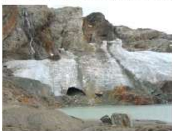
Figura 6. El Glaciar Monte Alvear Este. La porción meridional del borde del hielo tal como se veía en febrero de 2005. Nótese el tamaño agrandado de la cueva de hielo, la emergencia en este año de un gran bloque rocoso en la pared de hielo directamente a la derecha de la cueva, el cual no se observaba en la fotografía de 2004, revelando una notable recesión del frente del hielo de

varios metros en tan solo un año. Nótese también la exposición de remanentes de hielo oscuro por debajo del hielo blanco, más reciente, a la izquierda de la cueva de hielo, no visibles el año anterior. Este hielo oscuro, rico en detritos, es un antiguo remanente de hielo, de edad desconocida, quizás anterior a la 'Pequeña Edad de Hielo' (siglos XVI a XIX) y aun quizás, de una edad de varios miles de años o aun del Último Máximo Glacial (25.000 años atrás). La edad real de estos remanentes de hielo debe ser aún investigada. Lamentablemente, es posible que este hielo antiguo desaparezca rápidamente por fusión antes de que pueda ser muestreado adecuadamente. El afloramiento rocoso a la derecha de la cueva ha incrementado también su tamaño expuesto, a medida que el frente de hielo retrocedía.