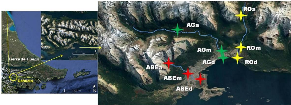
Figura 1. Mapa del área de estudio con los nueve sitios de muestreo. Por referencias ver texto.