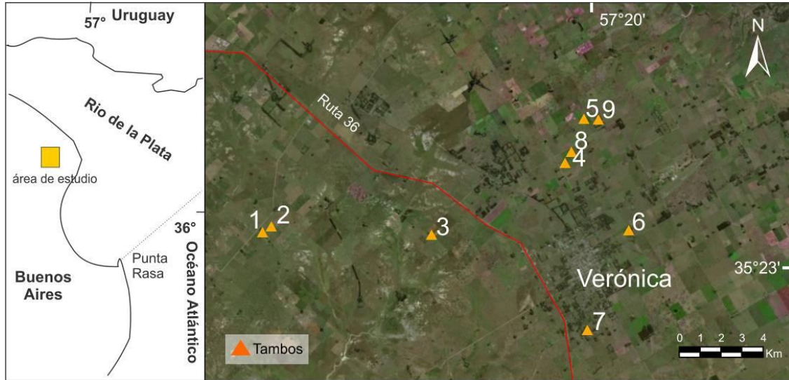
Figura 1. Ubicación del área de estudio y de los establecimientos tamberos monitoreados.

conductividad eléctrica (CE) y pH del agua subterránea con un equipo multiparamétrico portátil. En laboratorio se determinó el contenido de nitratos mediante método estandarizado (APHA 1998) en el Laboratorio de Geoquímica del Centro de Investigaciones Geológicas.