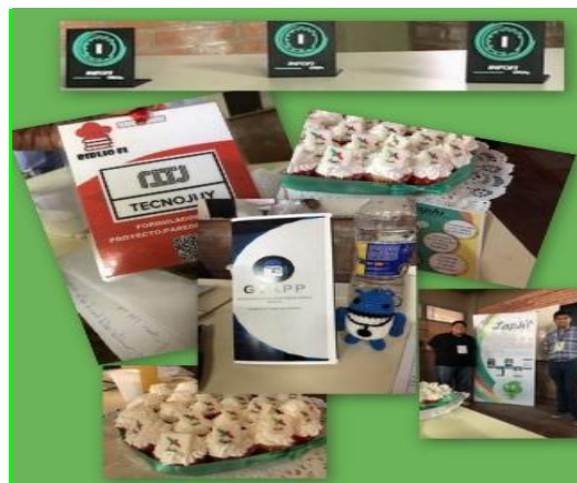
Fig. 4. Merchandising corporativo.