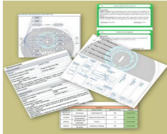
Fig. 8. Metodología de software. Collage de imágenes de trabajos finales