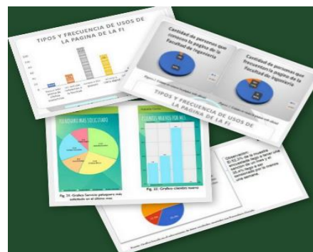
Fig. 5. Justificación del Proyecto. Resultados Encuestas Web.