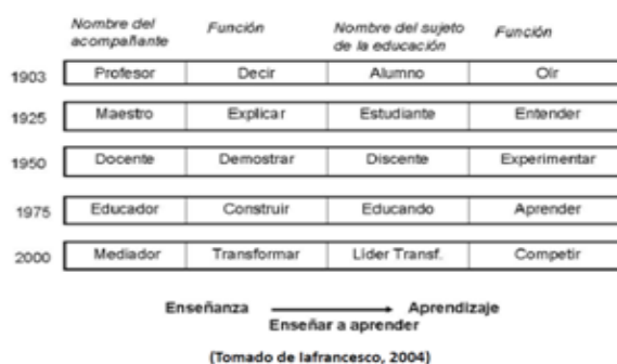
Fig. 1. Antecedentes en la Educación [1]

Hasta fines del siglo XX la enseñanza consistía en la transmisión de la información. De esta manera se esperaba que el estudiante desarrolle destrezas cognitivas, interactivas y manuales, y desarrolle actividades más bien rutinarias, la evaluación de los saberes consistía en una reproducción literal de saberes y estereotipos de acción, sin pretensión de cambio. El enfoque estaba en la “enseñanza”, importaba el “saber”. Luego el enfoque se trasladó al “aprendizaje”, cobró importancia el “saber hacer”. Desde fines del siglo XX se enfatizaron las competencias cognitivas, interactivas y manuales, a ser aplicadas a tareas no rutinarias; la enseñanza viró a una transferencia creativa de saberes diversos esperando un aprendizaje y dominio de competencias a ser aplicadas a situaciones nuevas y dinámicas.