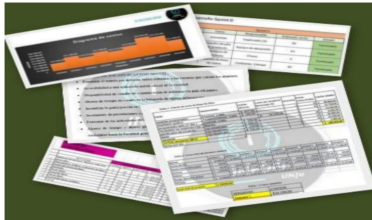
Fig. 7. Análisis Costo-Beneficio. Collage de imágenes de trabajos finales