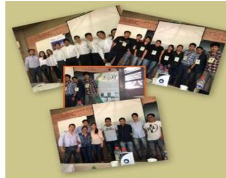
Fig. 3. Equipos de Trabajo. Collage de imágenes de estudiantes.