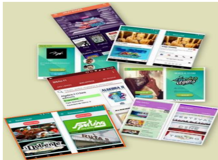
Fig. 9. Interfaces Prototipos.