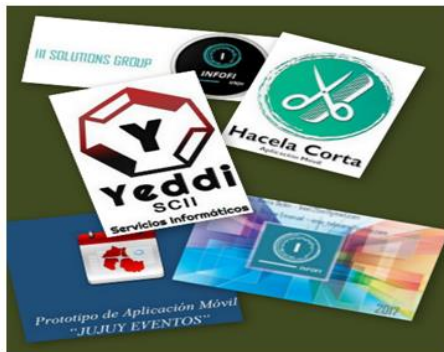
Fig. 2. Identidad corporativa. Collage de imágenes de trabajos finales.