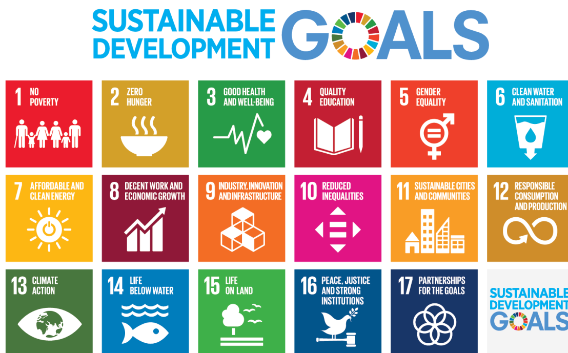
Figura 3. Objetivos de Desarrollo Sostenible (ODS)