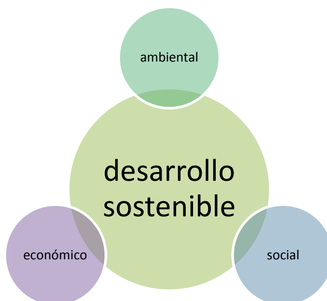
Figura 1. Ejes del desarrollo sostenible