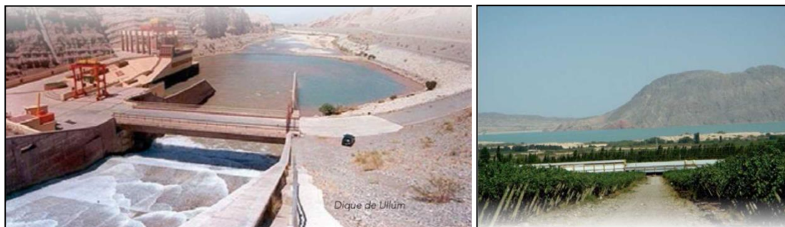
Construcción de embalses

En cuanto al ordenamiento legal del agua, en el año 1942, durante el breve gobierno del Valenzuela, se promulgó la Ley 886, vigente hasta nuestros días. Esta ley crea el Departamento de Hidráulica y ordena definitivamente la administración del riego, retomando en gran parte la tradición institucional legal hasta 1908, la que aseguraba la participación de los regantes a través de sus organizaciones. La Ley de Aguas 312 continuaba en vigencia.