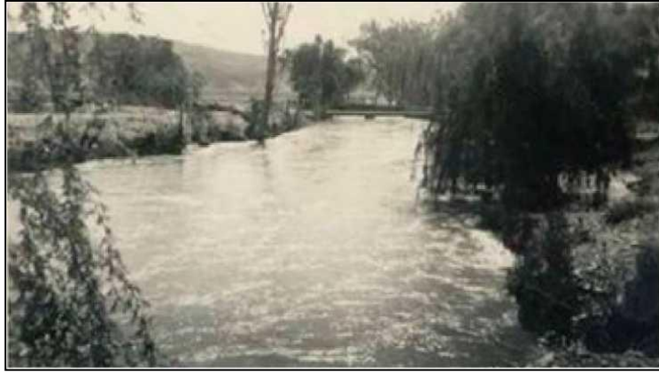
Canales con toma directa del río

Más allá de los cambios en la organización política luego de 1810 el Cabildo local seguía siendo el centro y lugar del poder. Esta institución, que ahora era la sede de un gobierno autónomo, reglaba la vida de los sanjuaninos respecto al comercio, justicia, infraestructura, salud y uso del agua. En 1821 desaparece el Cabildo como Institución.