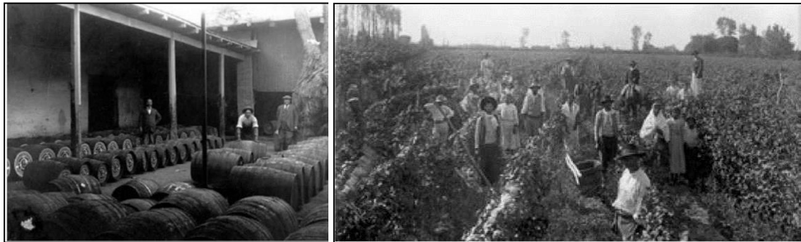
La expansión vitivinícola