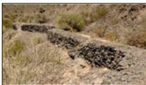
Vestigios de canales Incas

Existían muchos grupos de Huarpes en el valle Tulum, cada uno con su territorio y un cacique. Desarrollaron una red de canales en tierra que se interconectaban para el regadío de sus cultivos (Micheli, 1983). Aprovecharon la topografía y las pendientes naturales para encauzar las aguas (Damiani, 2011). Alrededor del año 1480 llegan los Incas y dominaron a los