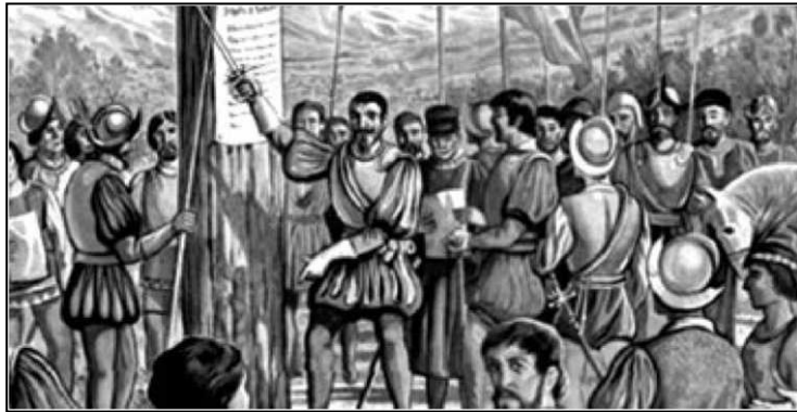
Fundación de San Juan

Desde su fundación y hasta 1776 San Juan pertenecía al Corregimiento de Cuyo, que dependía de la Gobernación de Chile y del Virreinato del Perú. Con la creación del Virreinato del Río de la Plata, Cuyo pasó a depender de la Gobernación Intendencia de Córdoba del Tucumán. El gobierno estaba a cargo de un Comandante de Armas, forma que duró hasta 1810, concentrándose la vida política en el Cabildo local.