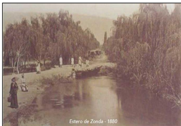
Esteros de Zonda en 1880

Entre 1860 y 1869 el gobierno de turno convocó a un ingeniero Francés, Mr. Nicœur, para algunas obras importantes, como el dique Soldano, con 20 metros de ancho y una altura de 8 metros, para cerrar la Quebrada de Zonda y retener las aguas de los Colorados (DH, 1999) 17 . Este ingeniero también aconsejó construir un dique en la boca del Río San Juan, el cual se realizó en 1869 y fue denominado La Puntilla (primera construcción).