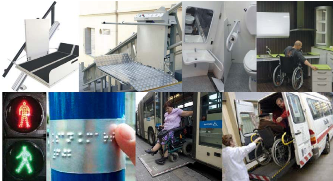
Fig. 3 Recursos para la accesibilidad. (ámbito público y privado)

derechos humanos y salud integral, se constituye en un concepto clave.