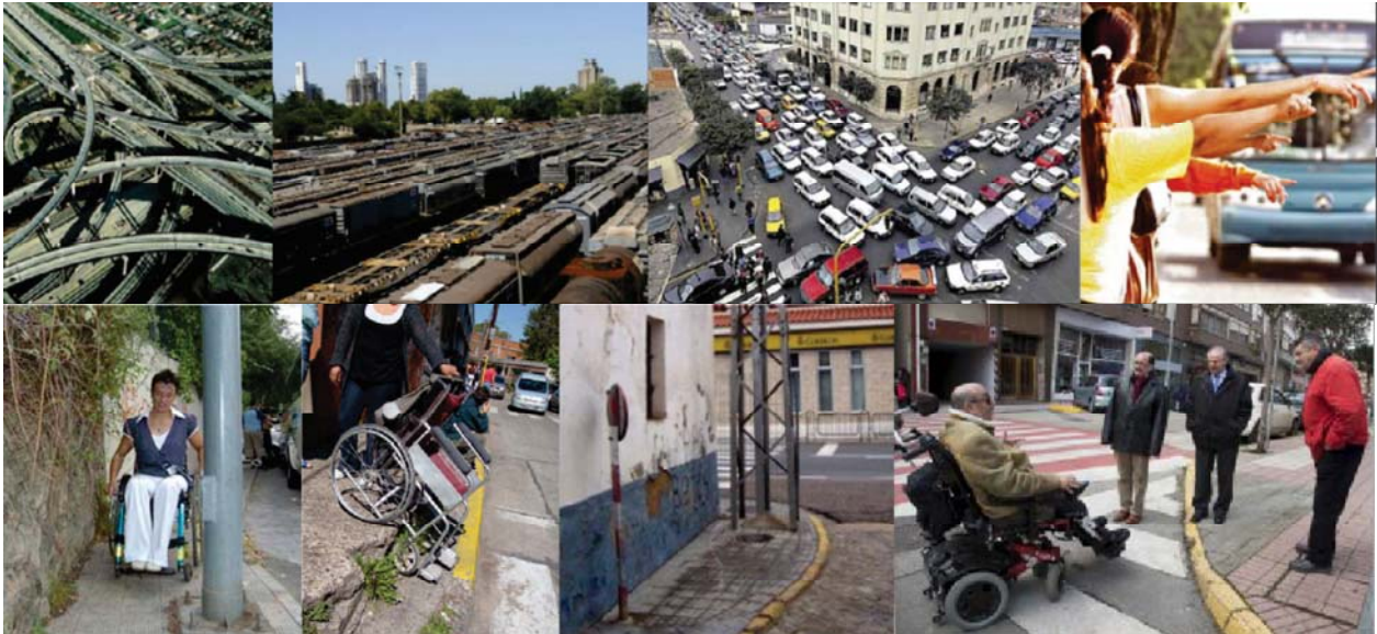
Fig. 1 Barreras físicas en el espacio urbano.

multidisciplina, comprometidos con la necesidad de mejorar las condiciones de seguridad del entorno, optimizando la igualdad de oportunidades y la inclusión dentro de una ciudad accesible.