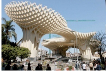
Figura 6. Proyecto y espacio urbano