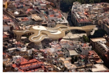
Figura 7. Foto Aérea