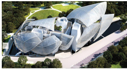
Figura 8. Maqueta digital. Inserción en el medio

Pensar en el momento inicial sin tener en cuenta la respuesta energética de la envolvente es impensable al ver la obra terminada, donde lo tecnológico, predomina junto a la forma, la emisividad y el control energético. Son los puntos fuertes a partir del resultado de las formas que salen como cascadas hacia el cielo.