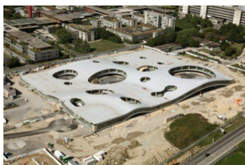
Figura 1. Rolex Learning Center (SANAA) Vista aérea

Vale a modo de ejemplo, citar el Rolex Learning Center en Lausanna, Suiza, construido en el año 2010 y proyectado por SANAA (Arqs. Kasuyo Sejima + Ryue Nishizawa), como una de las innumerables manifestaciones de formas inéditas en la historia de la Arquitectura. Esta obra muestra una síntesis del espacio arquitectónico que en cierta medida, se emparenta con principios compositivos del arquitecto Mies van der Rohe. Se trata de un edificio horizontalmente simétrico, pero en clave topográfica. Incorpora estratégicamente los cascarones del ingeniero suizo Heinz Isler, despojados de la esencia y pesadez estructural, con la pretensión de controlar el impacto térmico y energético, desde la propia forma.