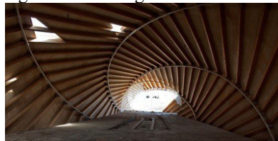
Figura 4. Espacio interior proyectado