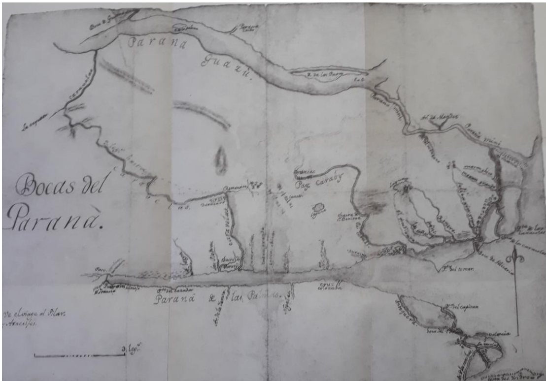
Relevamiento gráfico obrante en el Informe de Muñiz: "Noticias sobre las Islas del Paraná"

Posteriormente, a raíz de solicitudes de los pobladores, el Estado emprende acciones concretas y por Decreto N° 1696 del 18 de Febrero de 1857 autoriza a los Jueces de Paz de los partidos ribereños (San Nicolás, Baradero, Zárate y San Pedro) a conceder posesión de tierras de las Islas del Paraná ubicadas dentro de sus jurisdicciones. El Decreto fijaba tanto la extensión del lote frente al canal como su ubicación, especificando la reserva de uso público que cada Municipalidad podía disponer 8 . Aclaraba que "...cuando los límites fueran imprecisos, era el Gobierno el encargado de otorgar posesión" 9 .