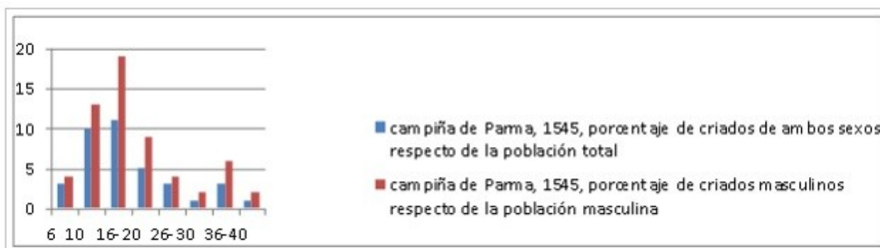
Figura 1 – Porcentaje de criados respecto de la población del grupo de edad, campiña de Parma, 1545