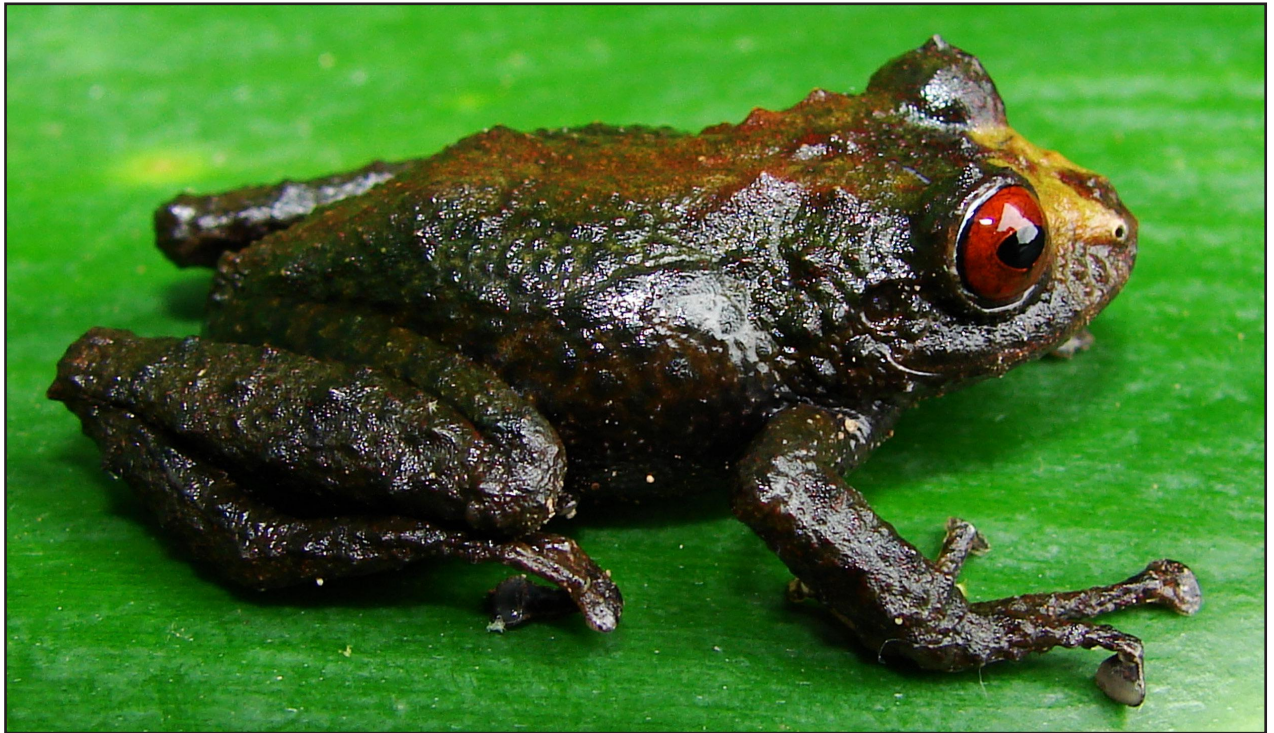
Figura 3. Pristimantis barrigai sp. nov., en vida. Holotipo macho adulto MEPN 12346, LRC: 26.9 mm.

del Cóndor (Ministerio del Ambiente, 2013), el cual está caracterizado por un bosque denso, cuyos arbustos presentan ramas nudosas y abundantes musgos, orquídeas y líquenes. La altura de la vegetación emergente alcanza hasta 15 m de altura, donde dominan arbustos de la familia Melastomataceae, Asteraceae, Araliaceae, Begoniaceae y Arecaceae. Pristimantis barrigai fue recolectado al borde de un riachuelo rodeado de vegetación natural, en la base de la meseta de la zona de Paquisha (Fig. 5A-B), los ejemplares perchaban sobre hojas de Begonia sp., a 3 m de altura.