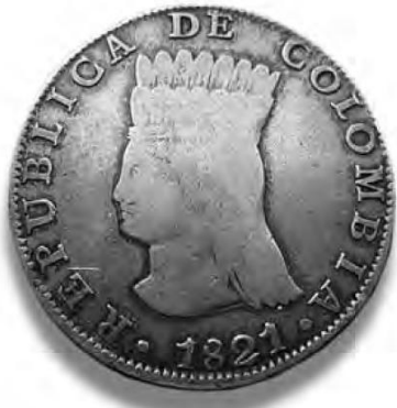
Imagen 3: Moneda Colombiana 8 reales "India Coronada" 1821.

Las formas de construir imaginarios en los diversos territorios americanos con la necesidad de crear una identidad a raíz de la diversificación cultural y el querer diferenciarse con la cultura española, se gestó a través de escritos que se manifestaron en la prensa y la literatura; el uso imágenes que circulaban en monedas (Ver Imagen 3), nuevos escudos nacionales y grabados difundidos en periódicos y libros.