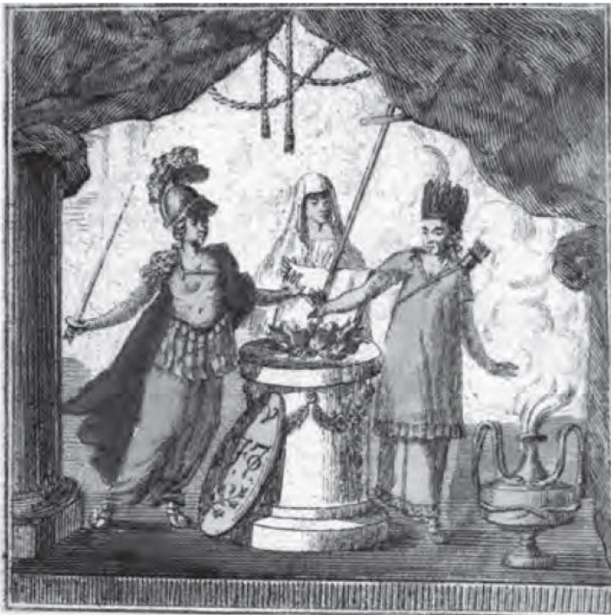
Ilustración 2: La antigua y nueva España juran en manos de la religión vengar a Fernando VII (1809)