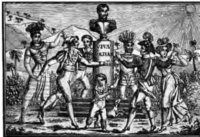
Ilustración 1: Grabado Venezolano, Los danzantes. Las coronas emplumadas reflejan la identidad indígena. Los festejantes rodean el busto de Bolívar.

Es entonces cuando entre los independentistas empezó a aparecer una nueva imagen de un santo laico, la imagen de la santa patria, figura femenina indígena, que se repitió por todo el continente de maneras diferentes. Esta figura no solo aparecía en la circulación de imágenes, sino que en los festejos se acostumbraba a vestir mujeres con atuendos indígenas (ver Ilustración 1) La difusión de este imaginario visual fue puesto en monedas, prensa, y grabados (Earle; 2011: 562). vi La aparición de este tipo de iconografía responde al surgimiento de grupos insurgentes y está ligado a la necesidad de construir identidades que puedan diferenciarse de España para así construir en el imaginario ideas de patria y nación. El patriotismo criollo intentaba una identificación que pudiera justificar su independencia, es así que buscaba en un pasado indígena anterior a la colonia, una idea de patria, a su vez que los realistas usaban la iconografía indígena para mostrar la unión de la corona con las poblaciones indígenas.