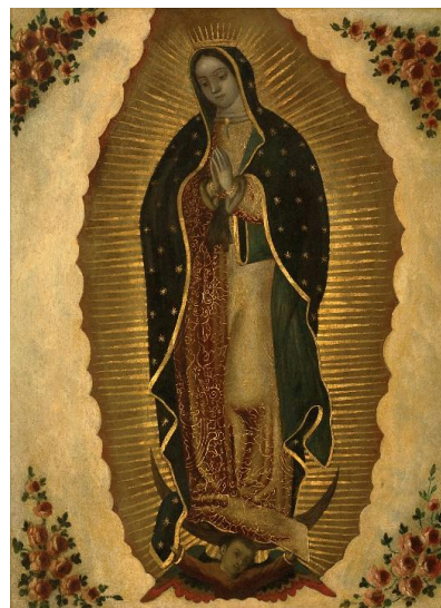
Ilustración 5: Virgen de Guadalupe. Escuela mexicana, siglo XVIII. Óleo/cobre

La identidad nacional primigenia nació en México, donde se desarrolló una independencia ritual/espiritual con la virgen de Guadalupe, y ciertas ideas de patria ligadas al pasado indígena como lo fue la alegoría de la patria mexicana. Estas se empezaron a gestar ya en el siglo XVII, unidas también a las primeras excavaciones científicas de las ruinas mayas. Este análisis científico del pasado se unió a las reivindicaciones políticas de los criollos. (Ver ilustración 5)