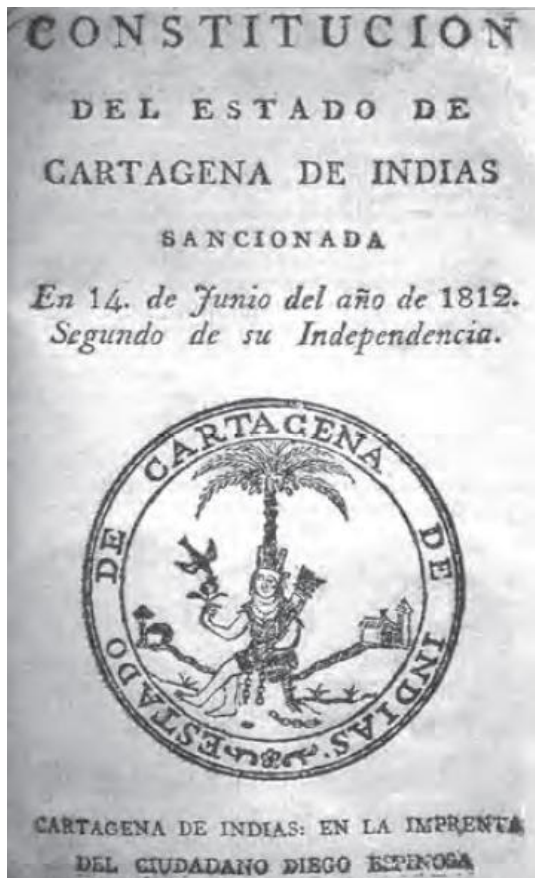
Ilustración 8: Constitución del Estado de Cartagena de Indias. Heráldica y Xilografía en la Independencia y en la República de Colombia. Boletín de Historia y Antigüedades 1812.