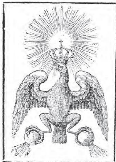
ARMAS DE CUNDINAMARCA.

El hecho de que los criollos acentuaron todo lo indio incluso en regiones donde ya no existía una mayoría india, como en Nueva Granada o en Venezuela, y que, por esta razón, no podían referirse a grupos concretos, prueba que aprovecharon la historia de la población aborigen para justificar su propia lucha contra el poder colonial español. (p.748) xiii