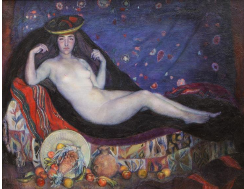
[Fig. 4] La Chola desnuda (1924) de Alfredo Guido

estéticas del noroeste argentino. Tal como lo expresa el Museo Municipal de Bellas Artes Juan B. Castagnino en su página web 2 :