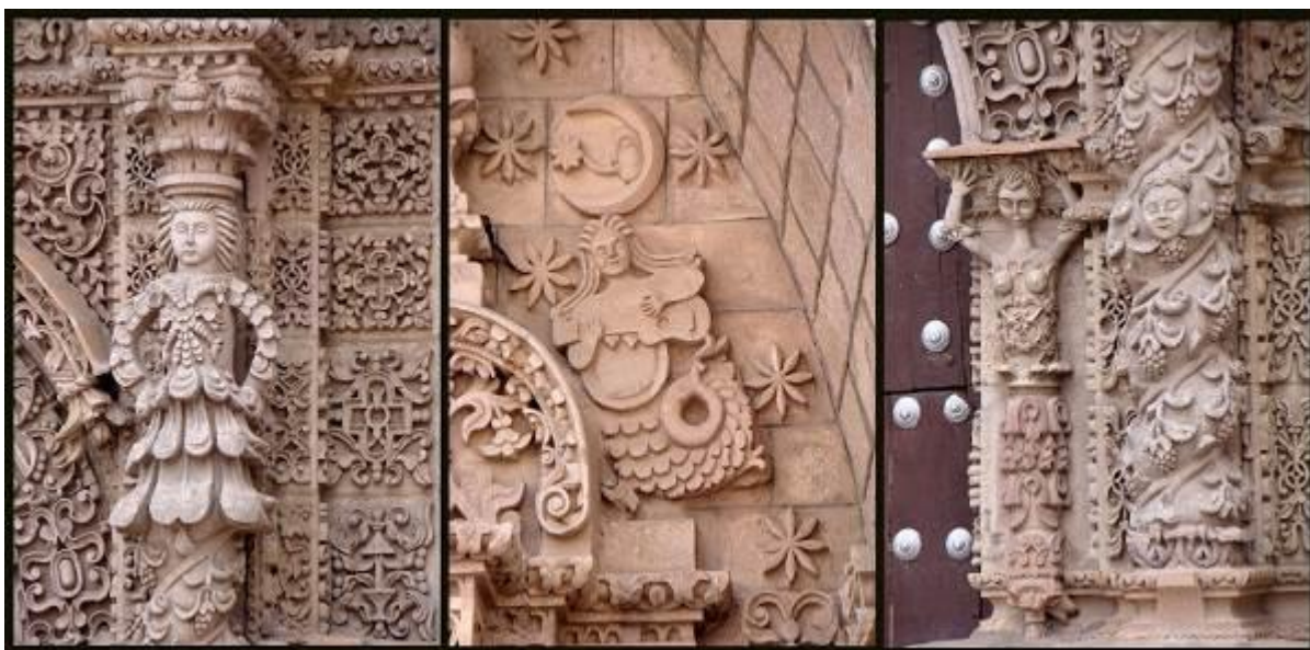
[Fig.2] Elementos sincréticos. Fachada de San Lorenzo. Potosí

Las estrategias evangelizadoras de los siglos XVI y XVII se evidencian plenamente en la arquitectura religiosa. La adaptación de la iglesia a los problemas específicos que planteaba la cristianización se concretó en soluciones sincréticas en las que se fundieron la estructura hispánica y el detalle aportado por las ideas y las manos de los artesanos indios, aún copiando el modelo español. (Báez-Jorge, p.132)