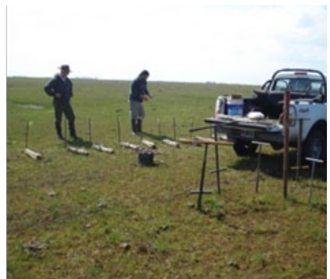
Planificación de una forestación con salicáceas. Fuente: propia.