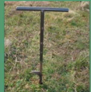
Foto 3. Barreta plantadora, Hilo de marcación y Proceso de marcación.