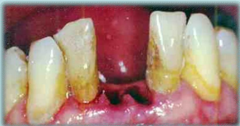
Exodoncia piezas 31 y 41

Posteriormente se acondicionan las piezas exodonciadas con Raspaje y Alisado Radicular, Endodoncia Retrógrada y Sellado Apical