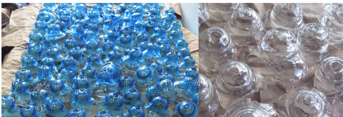
Pedazada proporcionada por la cristalería San Carlos para el Proyecto Adecuación de material vítreo como producto para nuevas aplicaciones.

En el año 2014 tomó forma el proyecto Adecuación de material vítreo como producto para nuevas aplicaciones , cristal San Carlos. El mismo fue el resultado de nuestra presentación a la convocatoria “Amílcar Herrera”, que nos permitía encuadrar en su contexto una investigación que se inició informalmente en el 2011. Para esta presentación ante el Ministerio de Educación a través de la Secretaría de Políticas Universitarias se formalizó aquel trayecto iniciado en el 2011. Desde 2009, como grupo de trabajo, estuvimos construyendo una relación fortaleciendo el vínculo que se inició como un contacto.