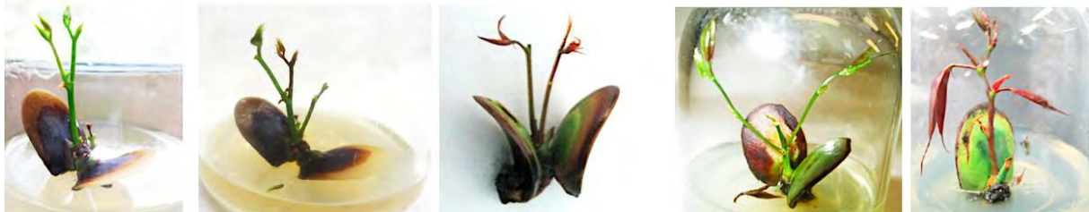
FIGURA 2. Múltiples brotes en nudo cotiledonar de P. purpurea cultivado en WPM suplementado con BA (0,5 mg L -1 ) y KIN (0,4 mg L -1 ).

El uso de la citoquinina BA promovió el número de brotes por explante y la KIN la elongación de éstos, sin embargo la interacción entre BA (0,5 ppm) y KIN (0,4 mg L -1 ) promovió procesos de organogénesis indirecta y evidenció la mayor inducción y elongación de brotes (3,0 brotes y 4,5 cm, respectivamente).