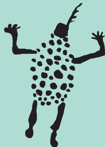
Pictografía Rupestre. Cerros Colorados. Provincia de Córdoba