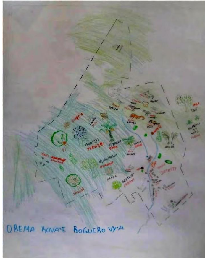
FIGURA 3: Primeiro mapa “aquilo que deixa o Mbyá feliz” (Orema kova'e roguero vy'a), são expostas as espécies da fauna e da flora nativa, a presença de roças com cultivos tradicionais, entre outros.