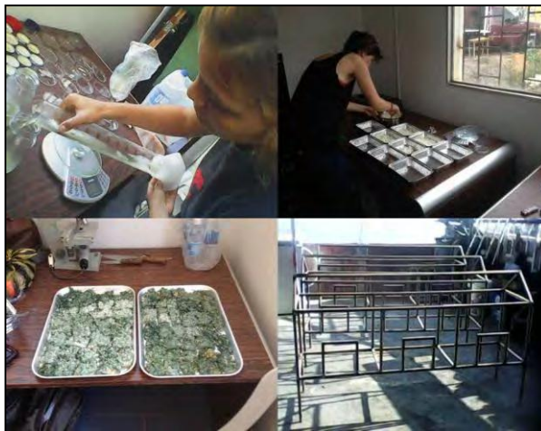
FIGURA 3: Experiencias en producción de Trichoderma y crías de Coccinélidos en el LAB.