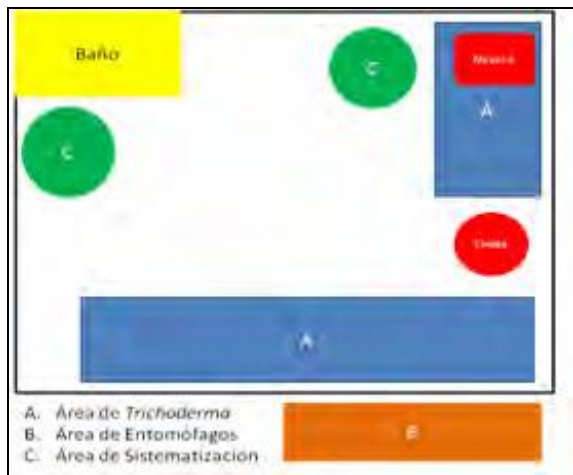
FIGURA 2: Diagrama del LAB Catia 5.

para la producción de coccinélidos según la metodología de Milán, (2008) y la de Sistematización de experiencias donde se lleva las bitácoras, protocolos y monitoreo de las parcelas acompañadas así como los levantamientos de índices de sustentabilidad.