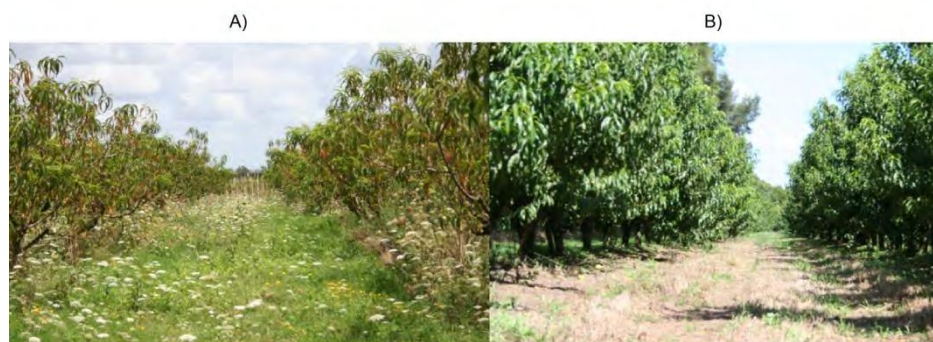
FIGURA 1. Fotos de montes de Prunus persica , donde A) corresponde al monte agroecológico y B) el monte convencional. Enero, 2015. Montevideo.

Se seleccionaron dos productores frutícolas del departamento de Montevideo, procurando que los manejos fueran diferentes. Uno de ellos se encuentra certificado por la Red de Agroecología, y adopta por lo tanto los principios agroecológicos, mientras que el otro es productor convencional. El estudio se centró en sistemas frutícolas de durazno ( Prunus persica ) (Figura 1). Se caracterizó el manejo de cada sistema para contrastarlos (Tabla 1).