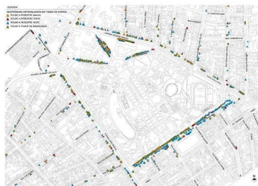
Fig. 8. Espacialização dos roubos a pedestre

Os cálculos das taxas de ocorrências criminais nas ruas adjacentes e proximidades do parque indicam que as maiores taxas de crimes por metro linear são coincidentes com ruas que possuem somente uma face edificada, ao contrário das ruas que chegam até o entorno do parque, que possuem edificações nos dois lados da rua (Tabela 8), sustentando as análises anteriores e corroborando as citações de Jacobs (2000) de que quanto maior o número de edificações voltadas para a via pública, mais segura ela se torna, uma vez que haverá maior possibilidade de supervisão da mesma pelos indivíduos.