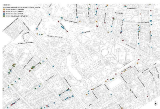
Fig. 7. Espacialização dos roubos de veículo