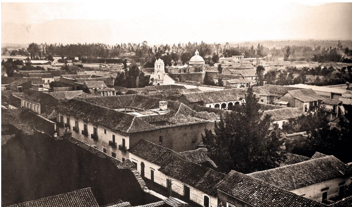
Fig.1. Fotografía de la Ciudad de Cochabamba del año 1915. Autor Rodolfo Torrico Zamudio

de su desarrollo histórico, han dejado plasmado un lenguaje y han definido un sentido que encierra la concepción de una realidad y un marco cultural que han prevalecido en la sociedad en un determinado momento.