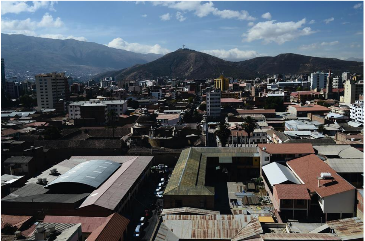
Fig. 2. Fotografía del centro histórico de la ciudad de Cochabamba. Año 2014.

El Centro Histórico denominado también “ Casco viejo ” de la ciudad comprende el área del Distrito V y está formado por 39 manzanas en torno a la Plaza 14 de Septiembre. Presenta una topografía predominantemente plana y totalmente urbanizada, con una densidad poblacional media fluctuante en relación a otras zonas de la ciudad, articulada por importantes avenidas radiales inter e intra-municipales (de norte a sur, Av. Ayacucho y de este a oeste, Av. Heroínas) con extensa disponibilidad de transporte urbano público y privado (micros, trufis, taxi-trufis y taxis).