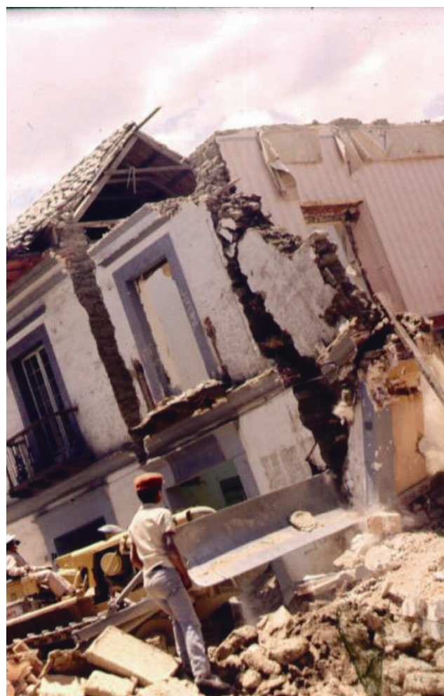
Fig. 4. Y 5 Fotografía de los trabajos de apertura de la Avenida Ayacucho, Año 1988 -1989.

Así, en el año 1976 se demolieron y en algunos casos se mutilaron 145 predios durante la apertura de la avenida Heroínas. En los años 1988 y 1989, en los trabajos de ensanche de la Avenida Ayacucho, se demolieron 128 predios haciendo un total de 273 propiedades. Si bien no se tiene el dato exacto de cuantos eran edificios patrimoniales puede suponerse que el número era elevado debido a la proximidad que estas dos calles tienen con respecto a la