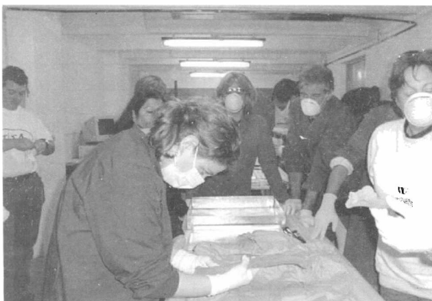
Limpieza e inspección de piezas.

El uso de materiales perdurables para su almacenamiento, el orden, la limpieza, el ambiente adecuado y sobre todo una conducta específica en la manipulación y manejo de las colecciones, son algunos de los aspectos a considerar a la hora de asumir una actitud preventiva en el cuidado del patrimonio. Una metodología