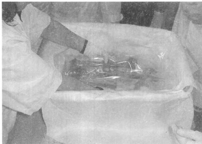
Práctica de embalaje.

rigurosa, con la planificación de acciones a corto, mediano y largo plazo es indispensable para la coordinación de acciones conjuntas y el éxito de cualquier emprendimiento de este tipo.