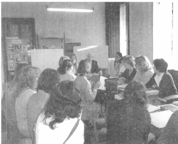
Un momento del curso.