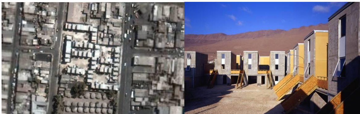
Elemental. Quinta Monroy, Iquique, 2003.

primera etapa, se diseñaron en sus dimensiones y proporciones como para ser compartidos por una cantidad de viviendas más o menos controlada. Se rechazó la posibilidad de crear un único ámbito central para fraccionarlo en cuatro espacios más pequeños intentando así lograr una apropiación efectiva de los mismos por parte de los vecinos.