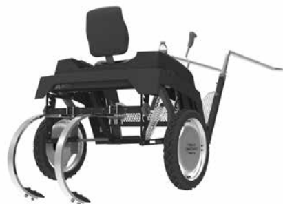
Vista del producto

Se arribó a un producto que busca dar respuesta a las necesidades del usuario, sin perder de vista la adecuación al medio. Entendemos que este producto aún la morfología y las características propias del equino con una tecnología a todas luces económica y eficiente. Y este ensamblaje posibilitará, en un futuro no muy lejano, obtener grandes réditos utilizando bajos recursos.